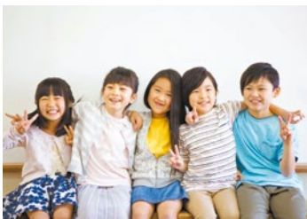
「できたよ」「すごいね」その自信と笑顔のために

視点も大切ですが、お子さんは保護者と違う視点で見ているところがあるのです。この子は何を求めているのだろうか、というところを考えつつ、それを理解してくれる事業所を選びましょう。療育の様々な場面できちんと説明をしてもらえるかどうか、そして、今だけでなく、長期的な視点で将来を見据えて、療育の計画を立ててくれるかもポイントになります。保護者の方に大切にしていたいただきたいのは、子どもを信頼すること。信頼されているとわかれると子どもは頑張ることが出来ます。そしてできたことをほめるだけではなく、一緒に喜んであげてください。共感してくれる人が居るといった経験を様々な場所で積み重ねていくことで、子どもは自信を育んでいきます。通所支援サービスと並行して、ご家庭でもできる療育に取り組んでみてください。