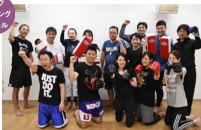
「初心者でも続けられるキックボクシング」がコンセプト!

「シティライフを見た」で ●体験レッスン参加料 通常1,500円→ ワンコイン500円 ●当日入会の場合、さらに パンチグローブ (3,200円相当) プレゼント (7月末まで)