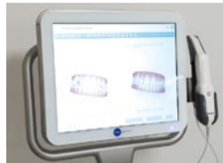
上)2019年4月にリリースされたばかりのインビザライン・ファースト。5歳~10歳頃までにご相談ください。下)3D光学スキャナー「iTero (アイテロ)」。スキャンにより短時間で型取りが終わり、精度は変わらずスピーディに治療を開始できます。