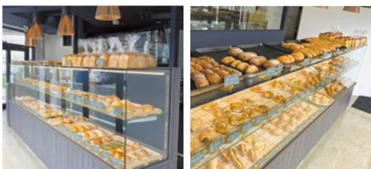
モダンな雰囲気店内。80種類以上のパンがズラリ。