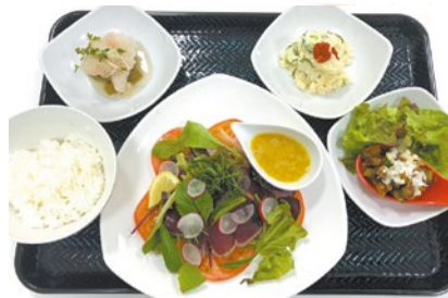
(上)月替わりのカツオのたたき定食(1200円)。7/6(土)からスタート。食欲が落ちる夏にこそぜひ。