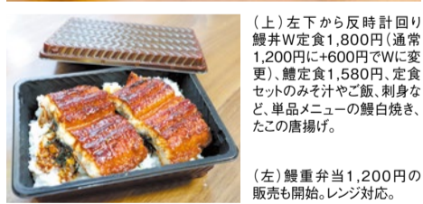
(上) 左下から反時計回り 鰻井W定食1,800円(通常1,200円)+600円でWに変更)、鰻定食1,580円、定食セットのみそ汁やご飯、刺身など、単品メニューの鰻白焼き、たこの唐揚げ。

元気に体力をつけてもらいたいという思いから、7月の食材のテーマは昨年登場したスタミナが付くといわれる「ながもん(長物)」、鰻(うなぎ)、鱧(はも)、タコ、穴子、太刀魚(たちうお)の魚たちに決定!「鰻の仕入れを担当する山田専務がまたもや鰻を仕入れ過ぎたため価格も値上げ無しで行きます!」とのことだ。さらに銀蔵初の鰻重弁当の販売も始めるそう。レンジ対応だから自宅でも楽しめる。さらに7月は土用の丑の日を控え、鰻の店頭販売も開始!