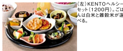
(左)KENTOヘルシーセット(1200円)。ごはんは白米と雑穀米が選べる。