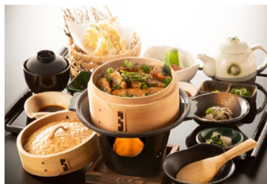
鰻のひつまぶし風わっぱ飯。まずはそのまま、だし汁をかけて2度楽しめる。