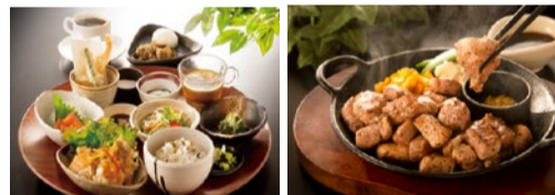
人気ナンバーワンのランチプレートはドリンク込で980円。甘み、サン、柔らかさが絶妙な四元豚のサイコロステーキも夏限定で登場!