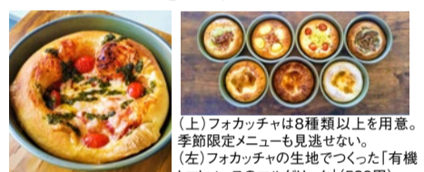
(上) フォカッチャは8種類以上を用意。季節限定メニューも見逃さない。(左) フォカッチャの生地で作った「有機トマトソースのマルゲリータ」(580円)。

有機のトマトソース、豚肉と塩だけでつくったドイツ産ベーコン、減農薬野菜など安全で美味しい食材を使用したフォカッチャとピザの持ち帰り専門店。おすすめはジャガイモを練りこんだフォカッチャ生地で焼き上げた「フォカッチャピザ」。モチモチの食感で公園などへのお出かけや土産にもぜひ。一番人気の「4種のチーズと林檎フォカッチャピザ」は必食の逸品!