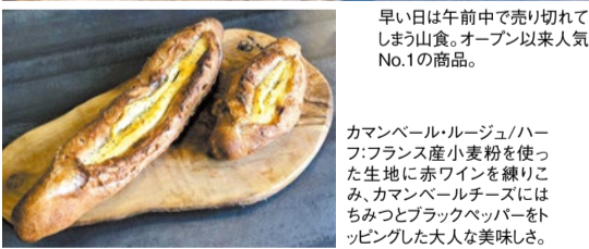
早日は午前中で売り切れてしまう山食。オープン以来人気No.1の商品。

最高級的小麦粉は、フランス産・カナダ産・北海道産、北海道産全粒粉など、パンの種類によって変えている。マーガリンは一切使わず、北海道よつ葉バターのみを使用。そんなこだわりが詰まった同店の一番人気は山食。ごまかしの効かないシンプルなものだから、素材本来の美味しさが伝わる。よつ葉の生クリームを使ったふわふわの食感なので、最初は手でちぎって食べてほしい。その他、季節の食材をいかした新作パンも続々登場!中央市場から届く新鮮な食材、厳選の塩で作る惣菜系や見た目も美しいスイーツ系もおすすめ。