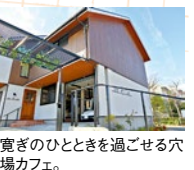
寛ぎのひとつきを過ごせる穴場カフェ。

今月のデザートは自家製のコーヒーゼリーとアイスが入ったフロート。甘さ控えめで、カフェオレ感覚で楽しめる。甘いのが好みの方はフレーバーシロップで味変も。他にもダッチコーヒー(水出し珈琲)など充実。お得なドリンクやサラダ付きのバスタセットは1,000円~。