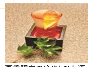
夏季限定の冷やしひれ酒 730円(税別)

脂ののった天然鰻と秘伝のダシが決め手の夏季限定の鰻なベコースは残すところあと2ヵ月。丁寧に骨切りされた鰻は花のように鍋を彩る。梅肉と酢味噌でいただく鰻おとしや唐揚げなど7品で旬の美食を心ゆくまで味わえる。また、とらぶぐのヒレを日本酒に三日三晩漬け込んだ冷やしひれ酒も絶品!