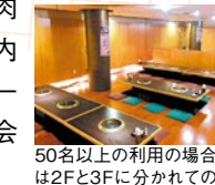
50名以上の利用の場合は2Fと3Fに分かれての利用になります

高槻を中心に7店舗のスーパーマーケットを展開するミートモリタ屋が手掛ける炭火焼肉店。直営だからこそできるお得な内容で、厳選された上質な肉がリーズナブルに味わえると大人気!宴会利用は最大120名まで予約可能!