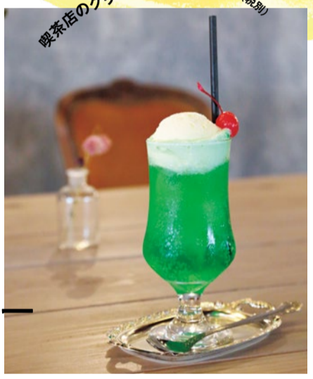
喫茶店のクリームソーダ 600円(税別)

一つひとつきちんと味つけされていて、北摂産野菜のおいしさを堪能できる。パン、ドリンク付きで1,380円(税別)。他に3種のランチがある。