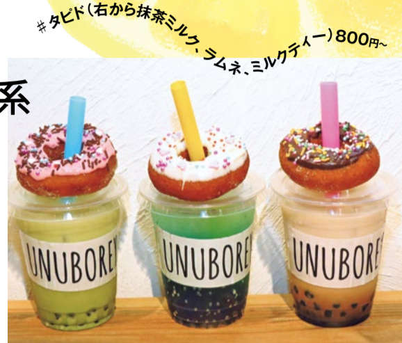
#タビド(右から抹茶ミルク・ラムネ・ミルクティー)800円~

UNUBOREYA (ウヌボレヤ) 高槻市高槻町14-7 営/ランチタイム11時~15時 カフェタイム15時~18時 カフェ&ダイニングバー18時~23時 不定休 ☎072-655-8281