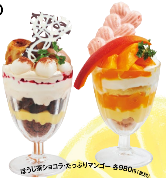
ほうじ茶ショコラ・たっぷりマンゴー 各980円(税別)