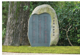
希望すると墓標に名前を刻むこともできる。

主人と一緒に夫婦で契約しました。主人は他界し、今は建仁寺に埋葬されています。生前に2人で話し合い「自然葬にしたい」と意見が一致して、建仁寺の樹木葬を選びました。歴史のある塔頭寺院の樹木葬なので格式があり将来的にも安心感があり、自宅からは遠いですが電車のアクセスも良く、観光ついでにでも気軽に墓参りに来てもらえると思って決めました。なにより墓地の雰囲気も良く即決でした。子どもにお墓の管理といった負担を残したくなかったので、早めに申込をすませられ、どこか安心できたように思います。(契約者 Nさん)