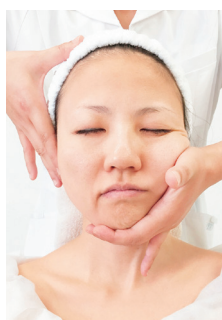
座ってお手入れする理由は、血流を3倍も高めるから。“イタ気持ちいい”圧も特徴で、首や肩のコリ、目やあごの疲れもスッキリ。

年を重ねて、肌の悩みが絶えないなら、たるみ・むくみ・しわ・ほうれい線をまとめて改善する「造顔マッサージ®」を試して。これは、世界的に著名な田中久子先生が開発した、1回でも小顔&アンチエイジングをもたらせるお手入れ。独自の手法で皮膚表面だけでなく、ストレスや首・肩のコリなどで硬くなりがちな筋肉にまで働きかけて、たるみやむくみの原因になる血流やリンパの滞りを改善。たまっていく老廃物や脂肪も押し流され、フェイスラインがぐんと若々しく!“すっぴん”に自信が蘇り、夏のお出かけがいっそう楽しくなりそう！