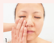
1 クレンジングでしっかり汚れを落とし肌をリセット。清潔にしてからお手入れをスタート。

顔の筋肉は、ストレスや首・肩のコリ、噛みグセなどで硬くなり、血流やリンパが滞って、たるみやむくみの原因に。「造顔」の正規継承サロンである当店では、数種類のハンドマッサージによりイタ気持ちいい圧を加え、老廃物を静脈やリンパに流し込みます。肩や首のコリもスッキリ!羨ましがられる小顔美人を目指して、ぜひご体験ください。