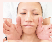
4 皮膚表面に加え、筋肉も刺激して肌の内側から活性化。ハリのある素肌へと肌質が変わるのを実感。