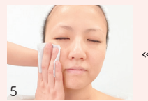
5 オリジナルの化粧品を使った十分な保温で仕上げ。わずか30分間で、小顔美人の完成!