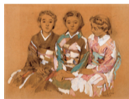
「小磯良平(三人姉妹) 1940年 個人蔵」

▶ 開催中～9/1(日) 10時～17時(入館は16時半まで) 月曜休館(ただし8/12は開館し、8/13は休館)