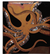
「蛸時絵螺細提重箱(ふた部分)」

▶ 開催中～8/26(月) 10時～17時(入館は16時半まで) 火曜休館(8/13は開館) 夏期休館8/19(月)～8/21(水)