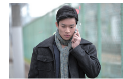
阪急西宮北口駅周辺もロケ地となっている。

自己資金を投資し、監督と二人で支援なしで、夢に賭けようと思っていましたが、映画の完成を約束できる段階にきました。ここからは、できれば多くの方に応援していただきたく、コンクールシーンやスタッフの充実などへご支援をお願いしています。西宮北口は4方向にアクセスする、人や文化の交差点です。楽器を持っている人も多く、宝塚スターも普通に歩いている、こんな駅は他にはないでしょう。住んでいる人、通り過ぎて行く人、多くの人の思いや地域の歴史を作品に込めて、愛される映画になって欲しいと思っています。