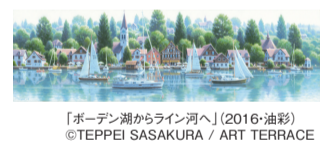
「ボードン湖からライン河へ」(2016・油彩) ©TEPPEI SASAKURA / ART TERRACE

▶ 開催中～9/23(月・祝) 火・水曜休館 10時～18時(入館は17時半まで)