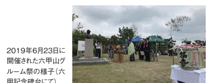
2019年6月23日に開催された六甲山グルーム祭の様子(六甲記念碑台にて)

夏は登山やゴルフ、冬にはスキー、スケートを楽しみ、別荘をもった外国人の山上でのレクリエーションを神戸・芦屋に住む日本人企業家たちが真似をしたことから、その後企業による開発もすすみ、観光地として発展するきっかけとなった。六甲山ではアーサー・ヘスケス・グルーム氏の功績を称えるとともに、夏山シーズン中の安全を祈願して毎年「六甲山グルーム祭」を開催している。