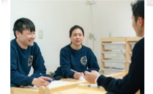
スタッフ同士でも連携し、子どもを見守る体制もしっかり整えている。

これまでの療育とは異なる、脳科学の知見を活かした科学的アプローチが特徴の児童発達支援教室。昨年オープンした箕面校に続き、北摂に3校目の開校となる。カリキュラムは、40種類以上のトレーニングを一人ひとりの発達状況や症状に合わせて構成するオーダーメイドカリキュラム。たとえば、お箸を使うことでその正しい持ち方はもちろん、脳に刺激を与え、3歳からの本格的トレーニングに備える「指先強化トレーニング」や、社会性を高める「ワーキングメモリートレーニング」などを実施。適切なトレーニングを重ね、自分をコントロールする力が身につくように導く。同時に保護者・通っている園・同教室の連携を強化。保護者には毎月、成果や状況のレポートを提出するほか、個別の面談や相談の場も設けており、子どもと保護者を全面的に支えてくれる。無料見学会は随時実施中。