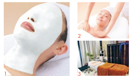
1.保湿効果も高く、肌本来の美しさへ。2.デコルテから顔全体を美肌マッサージ。3.ゆったりリラックスできる店内で心もリフレッシュ。

スタンダードコースでは肌トラブルをケアし、この時期に起こりやすい「くすみ」もスッキリ!※くすみとは古い角質により肌がくすんで見えること。