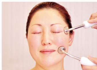
「実年齢には到底見えない!」と紹介・リピーターが絶えない、若返りフェイシャル。

同店の施術は「ほうれい線がなくなった!」「目元がぱっちりした」と喜びの声多数。しかもその効果が1ヵ月は続くというから驚き!