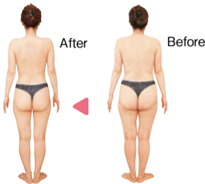
2か月間で体重-6kg、ウエスト-10cmに成功! 後ろ姿が一目でわかるほどすっきりした印象に。

全国1位の痩身サロンの最強メニュー「痩身モンスター」であの頃のサイズを 「お客様をお客を呼ぶ」 「ロコミでも人気」 「創業37年でいきついた」 「痩身モンスター」