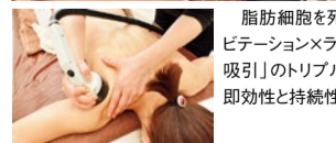
脂肪細胞を死滅させる「キャビテーション×ラジオ波×4種の吸引」のトリプルアプローチで即効性と持続性を両立。