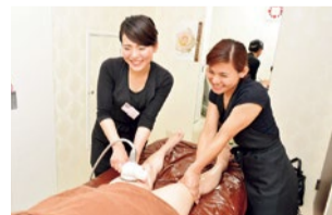
手技とマシンの合わせ技がすごい!

“攻め痩せお腹コース”で、長年なかったくびれが出現する方続出! 1回で「きつくなったデニムのボタンがすんなり閉まった」という声も。