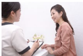
ひとり一人にあった効果のあるメニューを相談しながら作っていく。