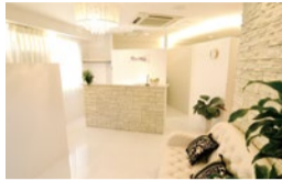
白で統一された清潔感のある店内。