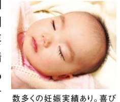
数多くの妊娠実績あり。喜びの声など、詳しくはHPで。

煎じ薬、粉薬の調合も行う北摂でも数少ない漢方専門薬局。子宝相談は評判で同店の得意分野。親身で話やすく、病院での治療やご主人さんのこと、職場の悩みなど相談される方も多い。40代の妊娠も多く、他県からも相談に訪れるそう。細かく時期や体調を見ながら、「今」必要な漢方で体を整えていく。精子数、運動率の改善実績も豊富で、自然での妊娠を希望されている方にも心強い。