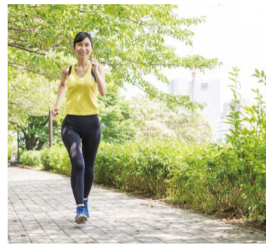
適切な運動でおすすめなのはウォーキング。週に2回、1回30分程度でも継続することが大切です。また「肥満」も「やせ」も不妊症のリスクを高めると言われていて、理想的なBMI値は20〜24。また、現代の若い女性は「やせ」の人が多く、栄養不足が指摘されているのでサプリメントで補うのもひとつの方法です。