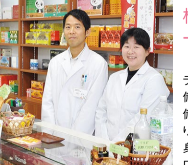
当クリニックの培養士

この写真の雰囲気の通り、やさしく相談しやすい人柄。国際中医専門員の資格を持ち、これまでの経験や豊富な知識から的確に体質改善へ導いてくれる。不妊症、アトピー、自律神経失調症など不調を感じたら相談してみてください。