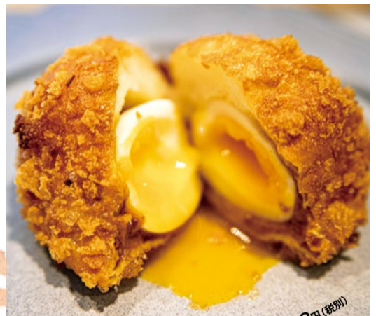
カレーパン 232円(税別)