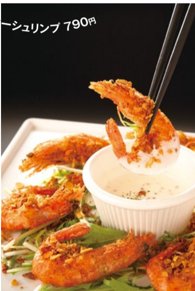
ファイヤーシュリンプ 790円

マンゴーの果肉たっぷり、人気のデザート! たっぶりマンゴーとオレンジゼリーパフェ450円 ※全て税別