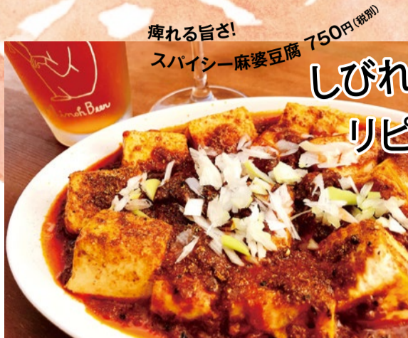
痺れる旨さ! スパイシー麻婆豆腐 750円(税別)