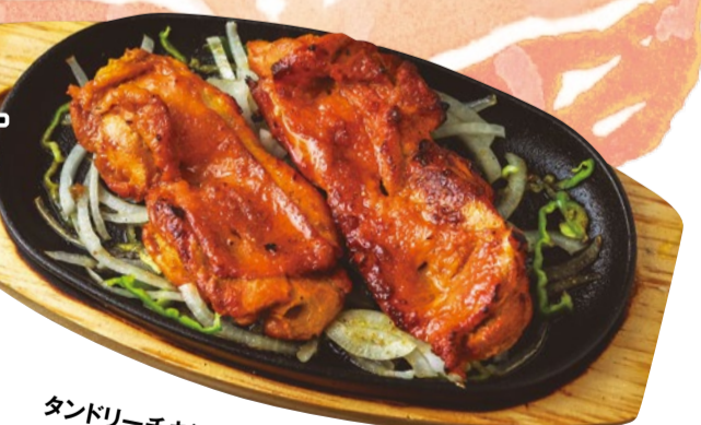
タンドリーチキン 1ピース 500円 (2ピースからディナータイムのみ)