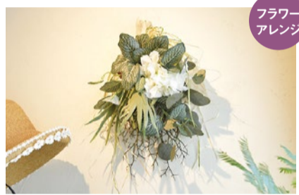
フラワーアレンジ

阪急茨木市駅からすぐのヴィンテージビルの3Fに佇む小さな雑貨店atelier MinT。雑貨、アクセサリ、フラワーアレンジの販売の他、フラワーアレンジは教室も開催。今回は上質なアーティフィシャルフラワーを使ったグリーンのスワッグ作り。「部屋の白い壁にもびったり合うユーカリやスタッグホーン等のグリーンと、アジサイの白が映えるナチュラルで飽きのこないスワッグです」とのこと。詳しくは電話、インスタにて。