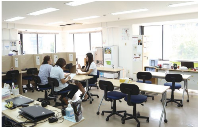
広々とした事務所で、集中して就労に向けた準備ができる。