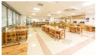
病院内のカフェで接客・パン製造の実務経験を積める。