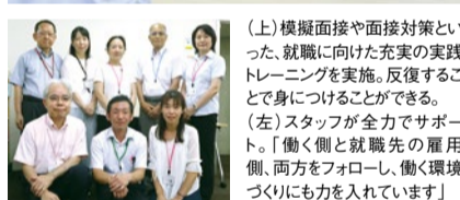
(上) 模擬面接や面接対策といった、就職に向けた充実の実践トレーニングを実施。反復することで身につけることができる。 (左) スタッフが全力でサポート。「働く側と就職先の雇用側、両方をフォローし、働く環境づくりに力を入れています」

就労移行支援事業を行う「はな」では、「働き続ける」を最も重視して、多様な訓練プログラムの実施。その特色は、作業やビジネスのスキルだけでなく、社会で求められるマナーやコミュニケーション力といった「人間力」を磨くカリキュラム。わからないことも「しっかり聞く」「SOSのサインを出す」という伝え方の訓練も含め、社会人としてのベース、マインドなど「働くチカラ」を総合的に育む。