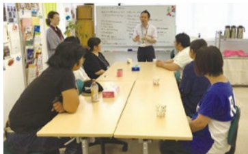
グループワークや面談は笑い声が絶えない。