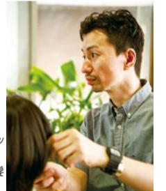
(右)髪を傷めない絶妙なグラデーションカットに定評のあるオーナー。 (左)ショートカットに挑戦したい方、今の髪型を綺麗に続けたい方から絶大な人気!!

暑い日が続くと、短くして毛量も減らしたくなる。そんな時に頼りになるのが同店。全体を細かく調整するまとまりの良い減らし方で、快適で美しいシルエットが手に入る。軽く、収まりが良くなり自宅でのスタイリングも簡単に。オーナーの髪を傷めない特殊技巧に惚れ込んで遠方からの来店ゲストも。スッカリ、軽やかな美髪になろう。