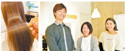
茨木市内でヘッドスパとトリートメントといえば同店。うるツヤな見た目まで若返り丁寧接客できると満足するはずだ。