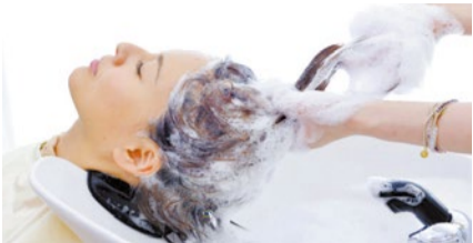
めっちゃくちゃ気持ちいいヘッドスパとトリートメント。通い放題を使って回数を重ねれば驚くほど髪質改善という。