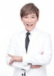
ファッションプロデューサー 植松 晃士 (うえまつ こうじ)

時代を先駆けた独自の審美眼でファッションプロデューサーとして活躍中。独自の審美眼と愛のある辛口トークでTV、ラジオ、雑誌など各メディアに出演。美容情報にも精通し、ファッションとビューティが美しく融合した究極のトータルコーディネイトを発信しつづけている。ファッション、美容の連載多数。