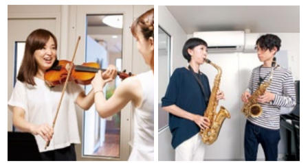
ヴァイオリンやサクソなど、学びたい楽器をレンタルできるのも嬉しいポイント(月1,300円~)。