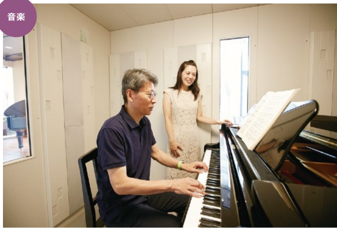
大人になってからの音楽って楽しい!音楽をきっかけに新たな目標が生まれ、毎日が充実してきたと話す人も多い。

楽しいレッスンが人気で初心者から経験者まで多く通う同教室。経験豊富な講師陣、高品質の楽器といった、充実した環境で音楽が楽しめるのも音大付属ならではの。声楽・ピアノ・ヴァイオリン・サクソなど学べる「マンツーマンレッスン」は、上達の早さが実感できると好評。身につけたい技術ややりたい姿などをヒアリングし、一人ひとりに合ったレッスンを組み立ててくれる。「昔からやってみたかった」と憧れの楽器を始める人や、「カラオケでうまく歌いたくて」と声楽を始める人も。今ならレッスン3回分を特別価格で体験可能!聴きただけだった音楽を自分のカラダで表現する楽しさにふれてほしい。