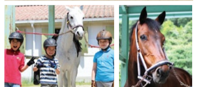
馬からの眺めと肌で感じる爽やかな風は日頃のストレスを吹き飛ばしてくれる。「神戸乗馬倶楽部」はJR三宮駅から(しあわせの村行き66系統)バスで30分、車だと20分(駐車場有)で行ける絶好のロケーション!