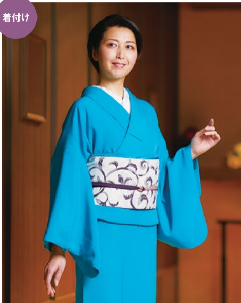
簡単着付けで楽しくキレイに!