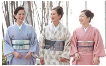
着物を着て、みんなでランチや観劇などお出かけする機会もあり。