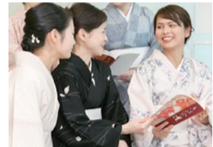
「通い始めて、着物が特別なものと思わなくなりました!」