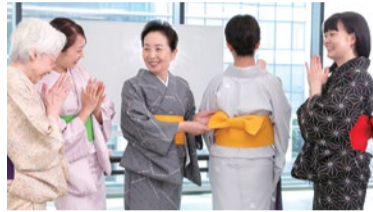
アットホームな雰囲気なので楽しい。

開講から48年、卒業生20万人と実績豊富な着付けの専門校「京都きもの学院」。着物の着方から帯の結び方など、気さくな先生達