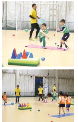
大小のボールを使って、的に向かって投げたり、蹴ったり、打ったりする「的当て競争」は基本動作を高める。