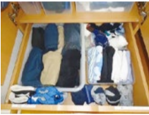
引き出しには、下着やズボン。カゴで仕分けて、しっかりラベリング。