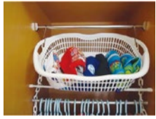
今は使わない部屋着は突っ張り棒をプラスして上部分の空いた空間にカゴを利用して収納。

小学1年生の男の子の収納例です。以前に教えながら一緒に整理収納をしたところ、今もそれを守って自身で管理できているようです。さらにラベルやカゴを駆使して、わかりやすく、取りやすく工夫しました。