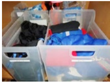
週5で通うサッカーのユニフォームは、他と混ざらないようケース収納。