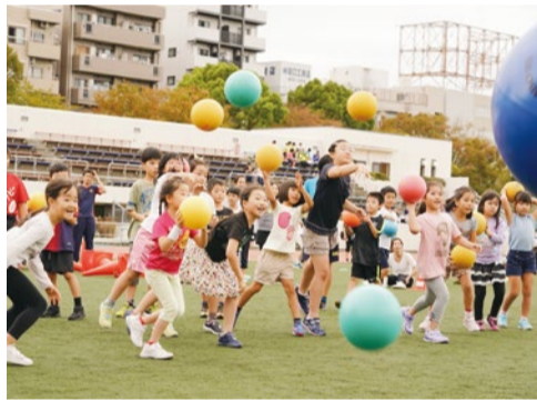
バルシューレはあくまで遊びなので、野球のような投げ方の指導はしない。子どもたちが実際に色々な動きを行う中で、自分で考え、経験し、身につけていく。