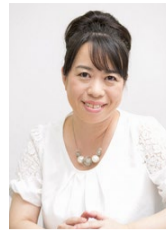
この方に聞きました