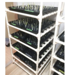
(左)活用事例①/空き家となった実家。オーナーは遠方在住に戻る予定はないが、実家近隣に住む親族への譲渡を考慮、自宅転用もできる一戸建ての賃貸経営を選択。 (右)活用事例②/空室の多い築古賃貸物件。周囲に競合物件も多いため、住居以外の活用を考慮、空室に設備を整え、水耕栽培施設としての賃貸経営を選択。