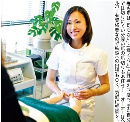
巻き爪は「切らない」「痛くない」と評判の同店へ。また自分では切りにくい分厚い爪の爪切りも任せ！オーナーはハルパー有資格者なので施設への出張もOK。気軽に相談を。

巻き爪、タコや魚の目など痛くて辛い毎日をお過ごしの方。足のトラブルから解放されたいなら、フットケア専門サロンのハルディンへ。足を出すのは恥ずかしいとためらいがちだけど、同店はプライベートサロンなのでその点も心配なし！足のトラブルによる痛み以外にも、自分では切りにくい爪切りや足の手入れだけでもOK！分厚い・変形しているといったシニアの爪ケアにも柔軟に対応してくれる。「汚い」「恥ずかしい」とためらわなくて大丈夫！まずは気軽に相談してみてください！