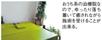
おうち系の治療院なので、ゆったり落ち着いた癒されながら施術を受けることが出来る。