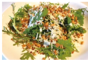
「一粒万倍グラノーラ」のグラノーラを使ったメニュー、ローカルベジチャーサラダ

醸造後、大量に出る麦芽カスを何とか活用したいと考えていた時、グラノーラ専門店である「一粒万倍グラノーラ」(神戸市中央区下山手通3-3-1)からこの麦芽を使えないかという申し出があった。廃棄モルトを焼き上げ乾燥させることで独特の匂いを消して香ばしさを出し、栄養価の高い