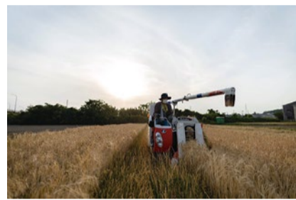
有機農法で野菜を作っているナチュラルイズムファーム

更に顔が見えることで、良質なものを届けたいという気持ちと責任感が生まれ、コミュニケーションによって問題点を逆に強みにする共生関係を生み出している。