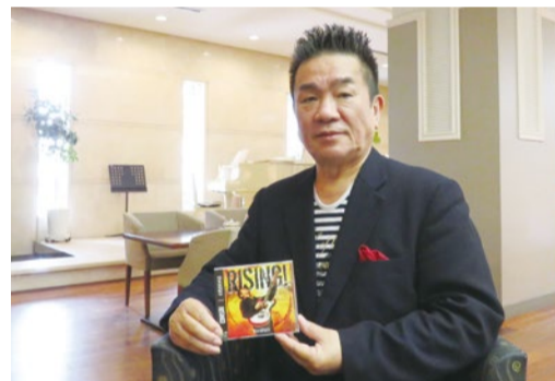
BORO(ボロ)/1954年生まれ、兵庫県伊丹市出身。1991年、筋ジストロフィーの少女・絢佳ちゃんとの出会い「AYAKA基金」を設立。募金を国に寄託し、難病支援、研究推進を訴え続けている。2019年、デビュー40周年を迎えた。

1979年、内田裕也氏のプロデュースによる「都会千夜一夜」でデビューし、同年発売された「大阪で生まれた女」が大ヒット。以来、数々のアーティストに楽曲を提供してきたシンガーソングライターのBOROさんがこの8月に10年ぶりのオリジナルアルバムを発表。2005年頃から約10年の闘病生活からの完全復活。今の想いをうかがった。