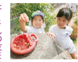
レモンやみかんの木にはアゲハチョウの幼虫が育ち、成虫がその周りを飛びまわります。園庭には自然がいっぱい。

[取材協力] 学校法人 岡辻学園 山手幼稚園 吹田市山手町1-15 ☎06-6387-3001 http://www.okatsuji.ac.jp/yamate/