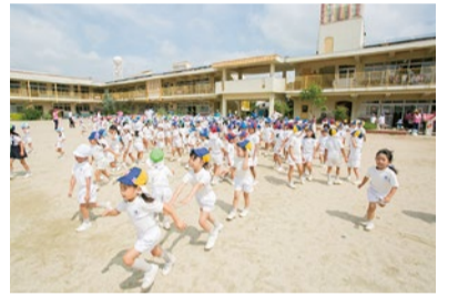
思いっきりダッシュできる広い園庭。3年間でしっかり体力がつくヒミツだ。

吹田にある山手幼稚園は、たくさんのお友達や先生と充実した3年間を過ごせる幼稚園。広い園庭、野菜畑、自園調理の温かくておいしい給食など、様々な魅力にあふれている。