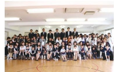
開室式の様子。楽しく元気に成長している現在のプレ生の様子はHPの「BLOG活動日記」でチェック!

北摂で大人気の知育幼児教室カウピリキッズスクールの理念は、IQを高める事だけでなく、子どもたちに『生きる力』を身につけてもらうこと。脳の成長著しい幼稚園入園前の1年間(4月~翌3月)に短時間の詰め込み教育方式ではなく、『母子分離での長時間保育』を行なう。知育・リミック・体操・絵画制作といったバランスの取れた『1日のカリキュラム』と『四季を取り入れた“遊び”』を通して、先生やたくさんの友達との関わりの中で思いやりや優しさに触れ、協調性やコミュニケーション力を身につけ、好奇心、持続力、忍耐力を培い『生きる力』へとつなげていく。子ども達が目一杯走りまわられる広々とした清潔感のある教室も特徴!前年の募集の際は、12月までにほぼ受入定員が埋まってしまったほどの人気ぶりなので、興味のある方はぜひ早めの体験説明会に参加を!