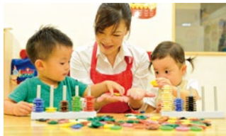
時代を先取りしたオリジナルカリキュラムと、質の良いボーネルンドの教具、有資格の専門家による授業で子どもの能力と自己肯定感を伸ばす。