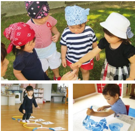
(上)お散歩で「虫さん、み〜つけた!」 (左)からだで覚える「はひふへほ」 (右)絵の具を使って、いっぱいぬりぬり!