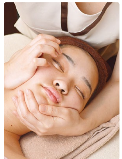
老廃物を流し出す「シルクde美骨顔筋マッサージ」。小顔効果抜群!

エステ通の間で話題のプラズマ美容「リブセラフェイシャル」を導入し6ヶ月、早くも喜びの声多数!加齢に伴うたるみ、ほうれい線に効果を発揮し、圧倒的な結果に驚くスペシャルメニューだ。また同店人気の「シルクde美顔顔筋マッサージ」は、顔の歪みを調整しながら溜まった老廃物やコリを流すので、目元がパチッと顔全体がリフトアップ!顔筋運動のEMSと生ビタミンCをたっぷり肌内部に入れ込んでいく。夏疲れ肌は放置せず、同店の施術で「肌が変わる」効果を体感して。