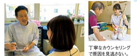
丁寧なカウンセリングで原因を見逃さない。