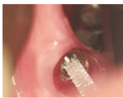
オリジナルブラシで清掃の様子