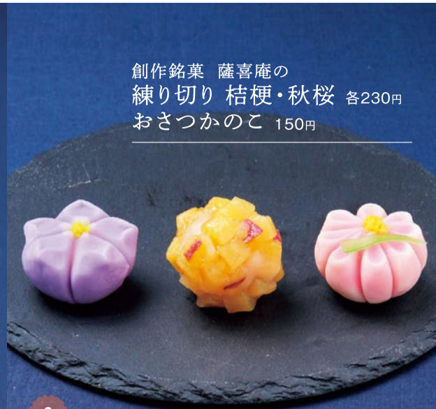
創作銘菓 薩喜庵の 練り切り 桔梗・秋桜 各230円 おさつかのこ 150円