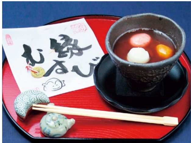
1 玉屋月心庵の 縁むすびぜんざい 750円