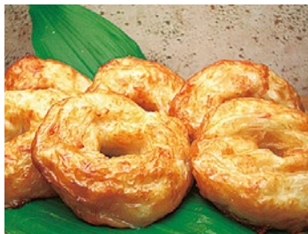
■藤熊(茨木市) 玉ねぎたっぷり天 1個 297円

淡路産の甘い玉ねぎをふんだんに使用した練り天。大根おろしとポン酢でいただくのがおすすめ。