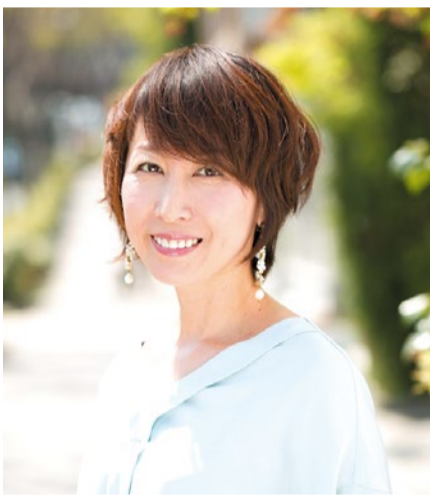
トリートメント・カラーに合わせて、軽やかに仕上がるカットも人気。来店周期やライフスタイルに合わせて髪型を提案してくれる。