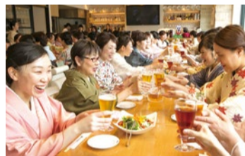
同じ趣味を持つきもの仲間と観劇や食事会を楽しむ「きものdeおでかけ」

平日夜間・土曜も開講しているので通いや、すいと好評。予定が合わない日は振替え受講もOK。着物や帯は無料レンタルも利用できる。手ぶらで通えるのもうれしい。着付けと一緒に茶道や礼法も学べるほか“一人で着物を着て出かけられるようになる”と人気の課外授業「きものdeおでかけ」も毎月開催。まずは無料体験レッスンに気軽に参加を。