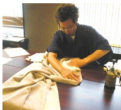
きもの手入れは「アフターケア診断士」にお任せ