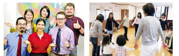
分け隔てなくフレンドリーに接してくれるネイティブのアメリカ人専任講師たち。標準的できれいなアメリカ英語を教えられる。1歳半~未就学児の親子クラスも人気。歌や遊びを通して自然と英語が身につく。幼稚園・小学生・中学生クラスも充実。