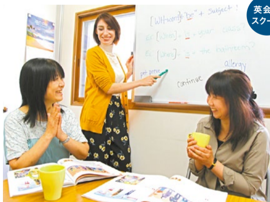
レッスンは「間違えてもOK」な雰囲気だから初心者でも気兼ねなくどんどん発言できる。「英語への苦手意識がいつの間にか消えて、英語が好きになった」という声も。