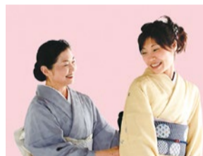
小人数制のわかりやすいレッスンが人気