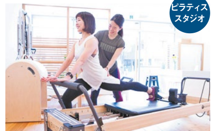
ゆっくりした動作で行うので、はじめての人や体がかたい人、運動が苦手な人でも安心して取り組める。

30~50代の女性に人気の専門スタジオ。リハビリから生まれた特別なマシンを用いることで、少ない負担でも高い効果を得られる。マンツーマンレッスンなので、一人ひとりに最適なプログラムも提案してくれ、心身のバランスが整った身体づくりを共に目指せる。「家から近い阪神間で本格的なレッスンに打ち込みたい」「集中してトレーニングできる自分時間が欲しい」「姿勢を改善し、しなやかで不調のない身体をめざしたい」という人は注目を。週末リセットの金曜日ピラティスがおすすめ!