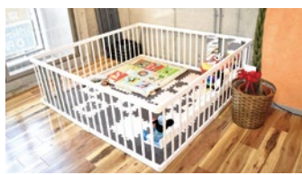
子どもと同じ空間で、安心して産後ダイエットや育児による肩こり・腰痛解消のトレーニングに励もう!