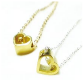
booth 028 | mz collection 出展日: 全日

一つ一つ丁寧に作り上げたネックレスやピアスをはじめ、シンプルで使いやすいデザインのシルバーと真鍮の指輪など