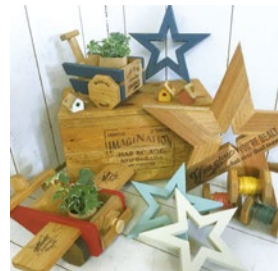
booth 081 | KAZU&kookaburra 出展日: 10月12日・13日

個性あふれるオリジナル木工と、ガラスなど多素材を使ったオリジナルアクセサリー／木工とガラスのコラボ作品