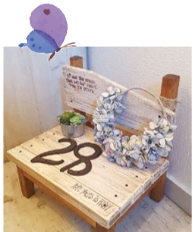
booth 079 | KanaHa 出展日: 10月14日