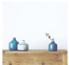
booth 037 | コイケヨシコ 出展日: 全日