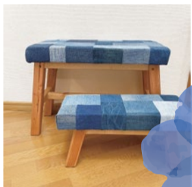
booth 034 | SMILE LIFE 出展日: 全日