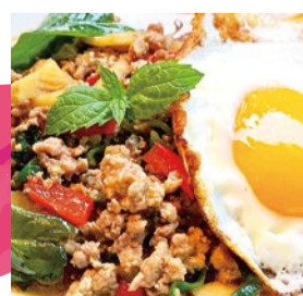
booth F13 | アロイ食堂 出展日: 全日