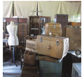
booth 007 | 古道具タイムミックス 出展日: 10月14日

マクラメと花を使ったインテリア雑貨の販売／ハーバリウムとアロマストーンワークショップ