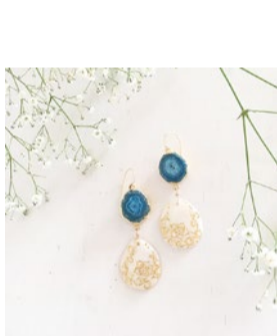
booth 056 | はぶくしゅSHOP 出展日: 全日