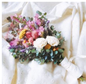
booth 063 | embellir.t.m 出展日: 10月12日・13日

一つ一つ丁寧に作り上げたネックレスやピアスをはじめ、シンプルで使いやすいデザインのシルバーと真鍮の指輪など