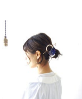
booth 023 | L'atelier de'hj 出展日: 全日