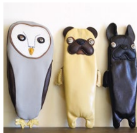
booth 012 | 森の人工房 Orang de Utan 出展日: 全日

花材を使用したリースやスワッグ、国内外のヴィンテージパーツを組み合わせたハンドメイドアクセサリーなど