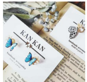
booth 038 | KANKAN 出展日: 全日

個性あふれるオリジナル木工と、ガラスなど多素材を使ったオリジナルアクセサリー／木工とガラスのコラボ作品