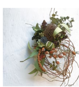
booth 003 | FineDay 出展日: 全日

10度の釜で丹精に2週間熟成し、アミノ酸ポリフェノールが数倍になった黒にんにくなど