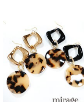
booth 082 | mirage 出展日: 10月14日