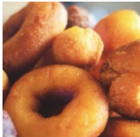
booth F19 | 菓子工房ふわり 出展日: 全日