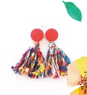
booth 054 | ENISHI 出展日: 全日

熊野古道の和の植物を中心に、流木盆栽、流木テラリウム、ハンギング自家製ドライフラワーのスワッグ、リースグッズ