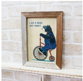
booth 077 | セレクト雑貨のコトック 出展日: 10月12日・13日