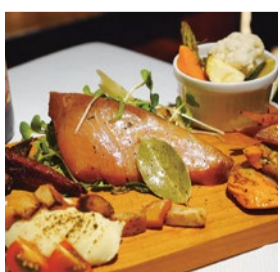
booth F03 | 日和佐燻製工房 出展日: 全日

徳島県産魚介と半熟卵、チーズなどの本格スモーク(保存料、化学調味料などは不使用)