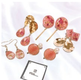
booth 078 | kteoo 出展日: 10月14日