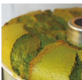
booth F11 | pieces焼き菓子のお店 出展日: 10月14日

徳島県産魚介と半熟卵、チーズなどの本格スモーク(保存料、化学調味料などは不使用)