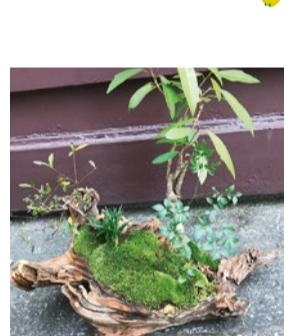
booth 067 | 紀古里 出展日: 全日

熊野古道の和の植物を中心に、流木盆栽、流木テラリウム、ハンギング自家製ドライフラワーのスワッグ、リースグッズ