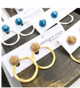
booth 049 | CRESCENT MOON 出展日: 全日

レジンや、リアルレザーを使用した大人な雰囲気、どこか遊び心もある洗練されたクールなアクセサリー