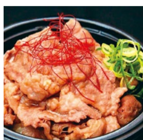
booth A03 | BAR WISTERIA 出展日: 全日

身体に優しい材料を使用し、ベーキングパウダー不使用の卵の力だけで焼き上げたシフォンケーキ