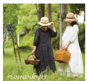
booth 011 | tsumuguhwt 出展日: 全日