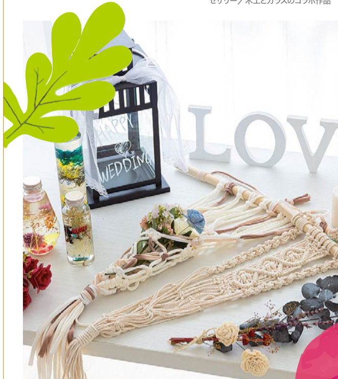
booth 075 | Natural Select 出展日: 10月14日

マクラメと花を使ったインテリア雑貨の販売／ハーバリウムとアロマストーンワークショップ