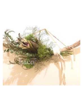
booth 063 | haco+せせり工房+mashum 出展日: 10月14日