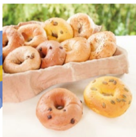
booth T06 LOVES BAGEL 出展日:10月14日

シュールでFunkyなデザインを一枚ずつ手刷り印刷したあとに、手刺繍を施したTシャツ