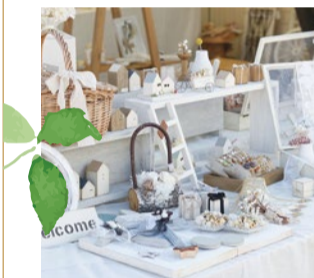
booth 082 You* 出展日:10月12日・13日