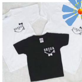
booth 033 93 出展日:全日