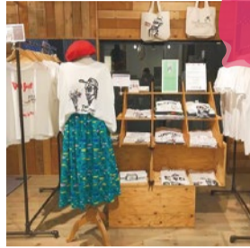
booth 045 フリーザーストア 出展日:全日

シュールでFunkyなデザインを一枚ずつ手刷り印刷したあとに、手刺繍を施したTシャツ