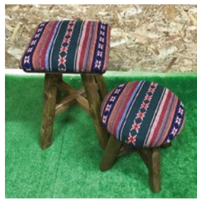
booth 051 tukur Woodwork Fujimoto 出展日:全日

落枝、流木、リメイク缶等で手作りした器に、光の入らないお部屋でも飾っていただけるアーティフィシャルフラワーのアレンジ