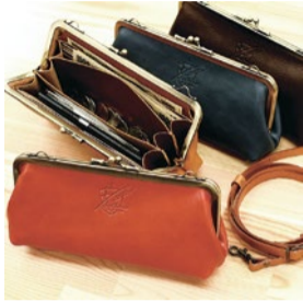
booth B04 B05 La vie heureuse[ラビクルーズ] 出展日:全日

上質な国産の革を使用し、金具等の細部の材料にもこだわり品質の高い長く大切に使うもらえる革小物