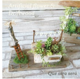
booth 027 Que sera sera 出展日:全日

落枝、流木、リメイク缶等で手作りした器に、光の入らないお部屋でも飾っていただけるアーティフィシャルフラワーのアレンジ