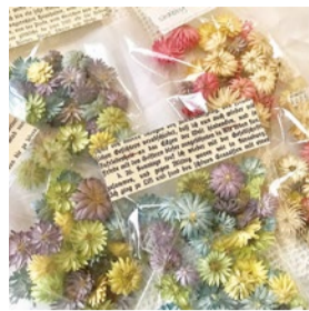
booth 074 shabby white 出展日:10月12日・13日

上質な国産の革を使用し、金具等の細部の材料にもこだわり品質の高い長く大切に使うもらえる革小物