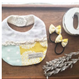
booth 091 Le son du reve 出展日:10月14日