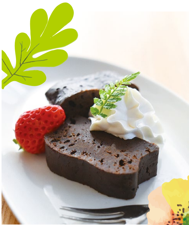
booth T01 ブラウニー母さん 出展日:10月12日・14日