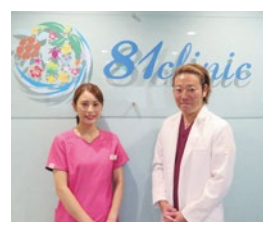
美容皮膚科だけでなく、美容外科医の資格を持った医師が診察を行い、ニーズに応えた治療、施術を行います。