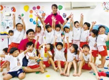
子どもたちのキラキラ笑顔が溢れている。