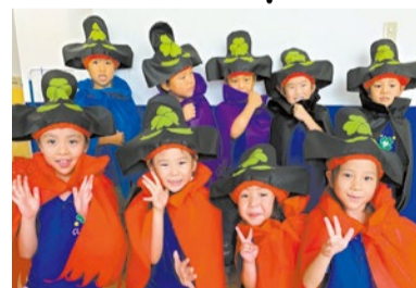
日本文化も楽しめる、季節のイベントも充実。

【開園】 月~土 7時半~19時 (第3土曜日休園日) 特典: 「シティライフを見た」と予約で ●1日体験教室が無料 (10月未まで)