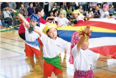
運動会や生活発表会も、難易度の高いものに挑戦する過程を大切にしていって、心と身体が成長する機会に。

“知育・徳育・体育の三育法を基にバランスの取れた人材育成”を理念に、平成21年に開園し今年で10周年を迎える認可外保育所の服部緑地園と、今年4月にオープンしたばかりの企業主導型保育園の江坂園。縦割りの異年齢保育を実施しており、思いやりの気持ちや責任感など社会適応能力の基礎が身につく。音楽・英語・体育・陶芸・制作・書道などの多様なカリキュラムで子どもの可能性を引き上げ、遊びの中からたくさんのことを学べる環境だ。「主体的に時代を生き抜く力、“人間力”を身につけて欲しい」という園代表の想いが、日々の保育に浸透しているのが特徴。園内には活発な子ども達の笑顔で溢れ、「保育園大好き!」な気持ちが伝わってくる。季節ごとのイベントも豊富で魅力あふれる保育園だ。12月より令和2年(2020年)度生の募集を開始。11月30日に説明会が開催されるので気になる方はお申込みを!