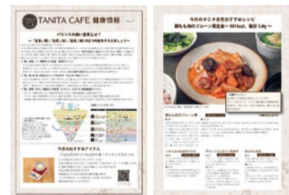
健康情報とレシピは定期的に更新される。

食堂カフェpotto × タニタカフェ® 吹田紫金山公園店 吹田市岸部北4-15-2 TEL.06-6155-4910 ※P34の関連記事もチェック!