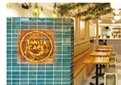
画像は東京のタニタカフェ有楽町店のもの。