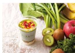
野菜やフローズンフルーツ、豆腐、チアシード、こんにゃくゼリーなどが入った、食べ応えのある噛むスムージー「カムジー」。

コツ」「タニタ食堂メニューの塩分量~減塩のコツ~」「お口の健康とにおいて」「生活に取り入れる運動のコツ」など、バラエティに富んだ内容。裏面にはタニタ食堂のレシピも掲載されているので、ぜひ参考にして自宅でも活かしてみてほしい。