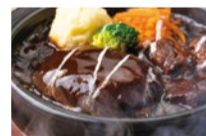
じっくりと煮込んだ深みのあるシチューが絡むジューシーなハンバーグが絶品のビーフシチューハンバーグ 1,480円

10月からランチメニューが新しくなった同店。11月には昼宴会やママ友会にもピッタリのランチ向けのコースが新登場!全8品で前菜からデザートまでしっかり愉しめる!ゆったりした空間でリッチ感ある料理がおすすめ。全ランチメニューでは+390円で焼きたてパン&新鮮サラダバーが食べ放題。