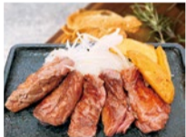
柔らかくジューシーなハラミステーキは680円(税別) ※バルタイムのみ

10月25日オープンのキッチンファーム。ハンバーグで人気の「モビーディック」がプロデュース。バルタイムには、いろいろな創作肉料理や女性におすすめのアルコール類が充実。古き良きアメリカンの内装も楽しめる。サラダバー付きランチもヘルシーでお得!