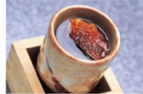
ひれ酒(730円)丁寧に焼き上げたひれを贅沢に使い、一口ごとに芳醇な香りが広がる。これからの季節外せない一品。

老舗店だから手に入る新鮮な最高級国産とらふぐを、注文ごとに捌くためふぐ独特のコクと歯ごたえを味わえる。旨味を引き出すゆず香る自家製ポン酢で食べるてっさは別格。メの雑炊はふぐと野菜の旨味たっぷり。11月からはお昼にもこの絶品が味わえる。みんなで堪能してみよう。