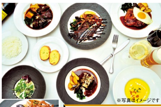
妥協なき下ごしらえと絶妙な焼き加減で、限りなく柔らかくジューシーな仕上がりに。ワインとの相性も抜群。

ホテルやレストランで長年修業を積んだ、確かな腕前のシェフが届けるディナー限定メニュー。「お肉料理は下ごしらえと焼き加減がすべて」と料理にひと手間加えることで、まるで高級レストランのような味わいに。そんな本格派ディナーは1,200円から!大満足の料理を堪能しに、ぜひ訪れてみて。