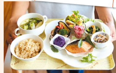
※写真はイメージです。内容は仕込により異なります。

▶セミナー参加申し込みはこちら下記URLの応募フォームより申し込みください。 https://pro.form-mailer.jp/fms/d18ff9b7176734