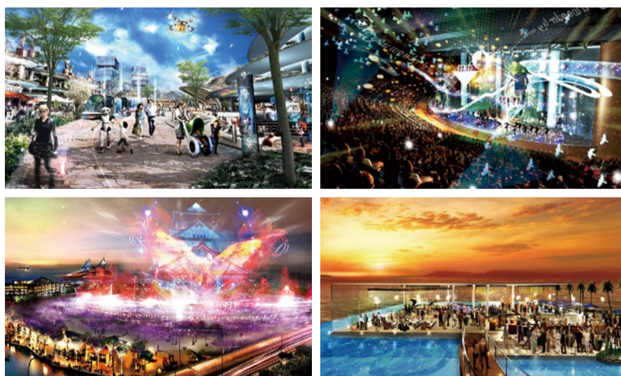
夢洲IRの施設の構想(案)

大阪府と市では2025年の万博開催時期での開業を目指しており、今年9月に事業者からコンセプト案を募集した。3社が手をあげたが、そのうちの1つは米IR大手のMGMリゾート・インターナショナルとオリックスの共同グループ。MGMリゾート・インターナショナルは世界各地でIRを運営している企業で、ラスベガスを中心と