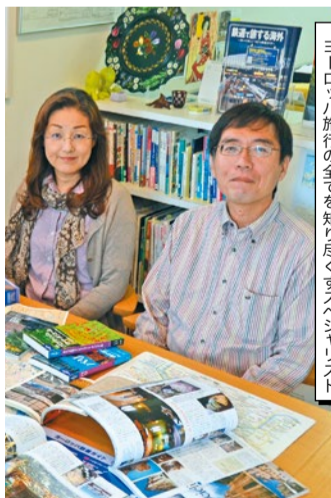
ヨーロッパ旅行の全てを知り尽くすスペシャリスト

成さん夫妻が、あなたの行きたい街、観光したい場所、やってみたいコトなどを「たった一つのオーダーメイドヨーロッパ旅行」としてカタチにしてくれる。旅の目的や予算に限らず、好みや生活習慣なども打合せで細やかに聞き取ってくれるので、あなただけの理想の旅行が出来上がるはず。ホテルを探さず、移動手段、急