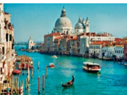
海の潟に浮かぶ水の都ヴェネツィア。

な病気やケガの時はどうすれば...。そんな面倒ごとを一手に引き受けてくれるので、ぜひ二人に頼ってみて。