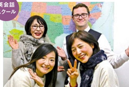
アットホームな雰囲気、先生もスタッフもとても親切だから、すぐになじみやすいと好評。