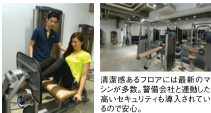
マシンの筋トレで身体が大きくなってしまおうのではと心配な人には、自重を使ったメニューも指導してくれる。

兵庫県内全8店舗を運営しているシナジムでは、プロトレーナーによるマンツーマンレッスンが好評。ダイエットだけでなく、姿勢改善やボディメイクなど、一人ひとりの目標を達成するために利用者に寄り添ったサポートを行う。画一的なメニューを追い込まれながらこなすというよりは、利用者の要望や体の状態に合わせて都度メニューを提案してくれるから、運動経験がない人や体力に自信がない人でも大丈夫!また、適切な栄養指導により厳しい食事制限もなく、無理なく続けられる。まずは無料体験で相談を。