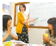
レッスンは「間違えてもOK」な雰囲気なので、恐れずに発言できてどんどんレベルアップ!