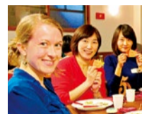
11月はサンクスギビングなど、アメリカ文化を体験できるイベントが多数。