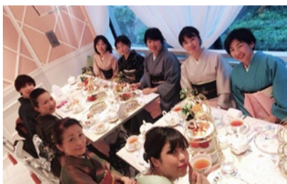
着付け教室で知り合った仲間と着物で楽しくお出かけ!

同店では「自分で着られるようになって、楽しくお出かけ、をモットーに、着付け教室を開校。リニューアルオープンに合わせて新規生を大募集する。練習用の着物・帯・小物一式は無料でレンタルできるので、通いやすと評判。授業は少人数制なのでじっくり学べ、3ヵ月あれば一人で着られるようにも! まずは無料体験に参加してみよう!