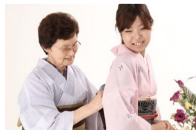
わからないことはすぐに聞けるアットホームな教室。