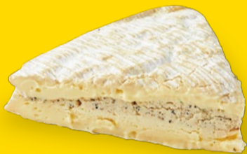
ブリードモートリュフ 1,200円/100g