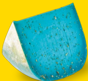
ラベンダーブルー 750円/100g

鮮やかなブルーが印象的な、ラベンダーなどハーブ数種類が練り込まれた香り爽やかなチーズ。