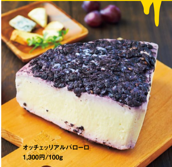
オッチェリアルパローロ 1,300円/100g