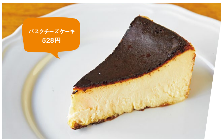
バスクチーズケーキ 528円

「脳裏に残る味」がコンセプトのチーズケーキ専門店。隠れ家のような店内はくつろげる雰囲気、1つだけあるテーブルでイトインも可能。なめらかさを追求したチーズケーキは常時約7種類揃う。中でも高温、短時間で焼いた「バスクチーズケーキ」は、ほろ苦いてっぺんの焦げがプリンのようにでありながら、トロトロのチーズが忘れられない味わいに。商品が売り切れ次第終了なので、来店前に電話やインスタでチェックして訪れてみて。