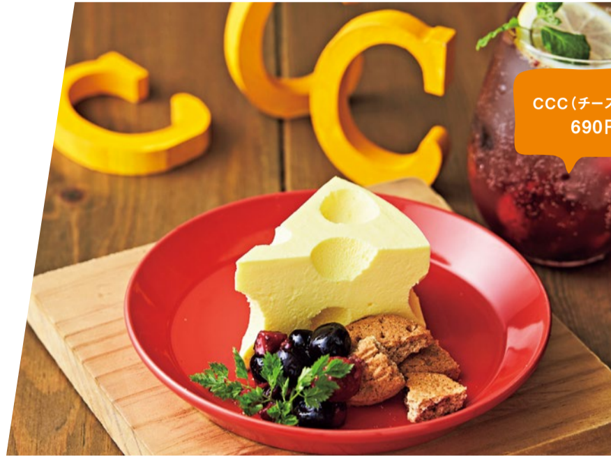
CCC(チーズチーズチーズ) 690円(税別)