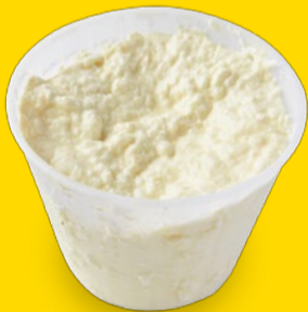
温泉水リコッタ 600円/100g ※要予約