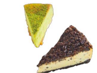
(左)抹茶チーズケーキ 528円