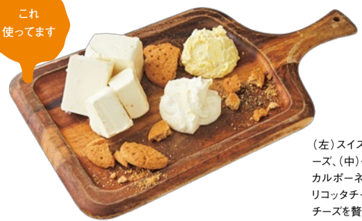
(左)スイス産クリームチーズ、(中)イタリア産マカルポーネ、(右)自家製リコッタチーズと、3種のチーズを贅沢に使用。