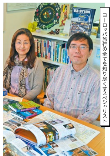
ヨーロッパ旅行の全てを知り尽くすスペシャリスト

長年旅行業に携わり、ヨーロッパ個人旅行に特化してからも経験10年以上のスペシャリスト。とてもお話ししやすい人柄に加えて、圧倒的な知識と経験を持ち、旬の現地情報も教えてくれるので「打ち合わせをしている時から楽しかった!」と評判。