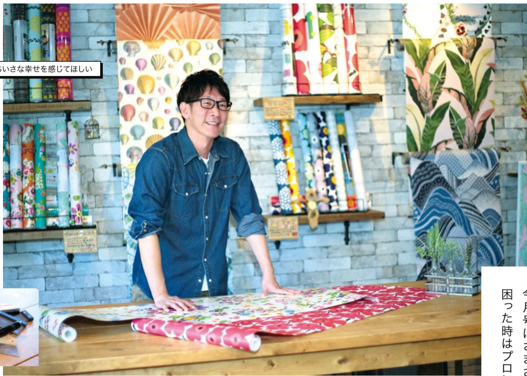
壁紙を通じて小さな幸せを感じてほしい

暮らしのなかで手がつけられなくて困っていることはありませんか。今月号はさまざまなジャンルで活躍するプロのワザを紹介し、困った時はプロに頼って快適な暮らしを楽しみましょう。