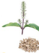
イノコズチ Achyranthes bidentata var. fauriei

秋、ハイキングに行くときよく小さな草の実を服につけて帰ってきます。動かない草木は、種子がその場に留まり続けると繁殖場所の場所取りを起すのが宿命。イノコズチは「ひつこき虫」になって、次の場所へ旅立ちを始めます。さあ、私達も秋色を探しに出かけましょう。