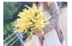
natural garden purplea