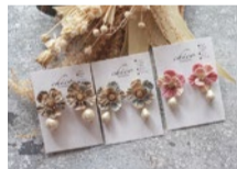
maison de calin