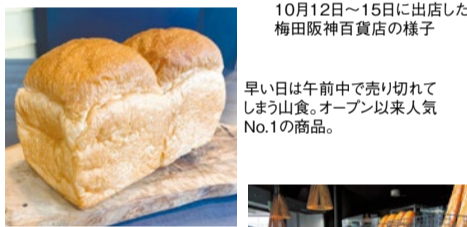
10月12日〜15日に新店した梅田阪神百貨店の様子

味の決め手となる小麦粉は、フランス産・カナダ産・北海道産、北海道石臼全粒粉など最高品質を厳選。マーガリンは一切使わず、北海道よつ葉バターとよつ葉生クリームを使用している。10月に新店した梅田阪神百貨店「バンワールド」では、同店一番人気の山食が焼いても焼いても間に合わないほど好評だったそう。金曜・土曜限定販売の「クロワッサン」もおすすめ!よつ葉バターの中でも昔ながらの製法で作られた特別なバターを使用。季節の食材をいかした新作も登場しているので、足を運んでみては。