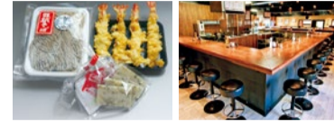
[年越しそば]300食限定 箕面店の店内