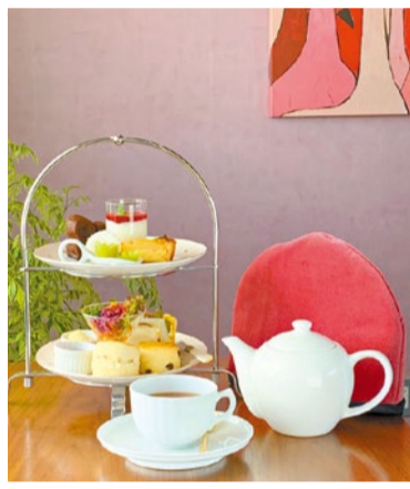
冬のアフタヌーンティー.....2,200円(11/20〜12/7限定)。内容はサンドイッチ、スコーン2種、スイーツ、紅茶。期間中の11時〜15時に数量限定で注文可。(予約がベター)