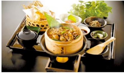
蒸し立ての美味しさをぜひ!季節のわっぱ飯ご膳1,250円